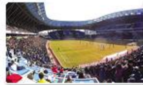
Sungui Stadium / Complete March 2012