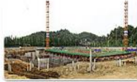
Namdong Stadium / 24%