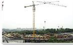
Munhak Aquatics Center / 40%