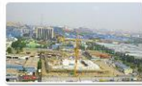
Songrim Gymnasium / 28%