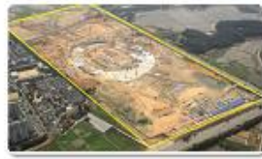
Main Stadium / 25%