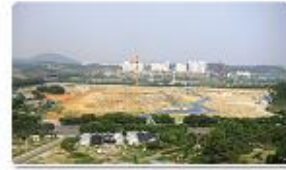
Seonhak Gymnasium / 16%