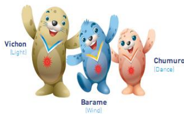
Linh vật chính thức của Đại hội