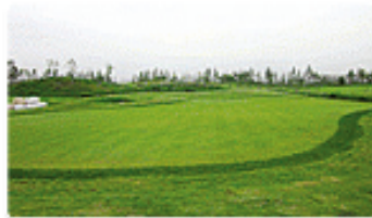
Dream Park Golf Club / 93%

* Ngày 26/3, đã chính thức thành lập một Ban tư vấn lễ hội bao gồm 17 chuyên gia từ nhiều lĩnh vực khác nhau như văn hóa, âm nhạc, phim ảnh, công nghệ thông tin và võ đạo. Ngay sau khi thành lập Ban tư vấn, IAGOC đã bắt đầu chính thức bước vào chuẩn bị cho các lễ hội tại Đại hội Thể thao châu Á lần thứ 17, bao gồm cả các sự kiện văn hóa.