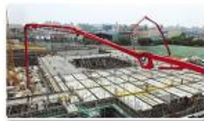
Sijong Stadium / 22%